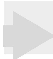
Regeling aanmelding en selectie hoger onderwijs

De paragrafen 3, 4 en 5 van dit hoofdstuk, hoofdstuk 3 en artikel 32 zijn uitsluitend van toepassing op fixusopleidingen.